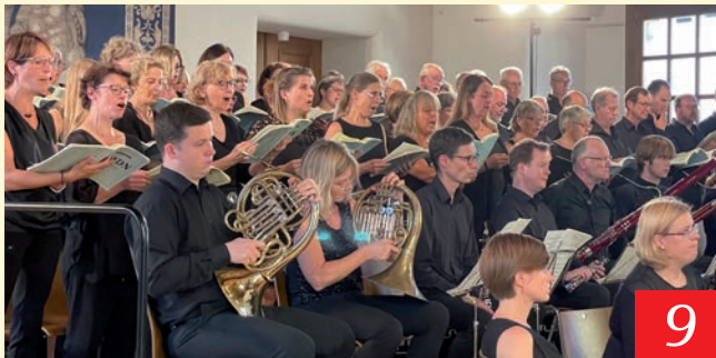
9 Neuanfang nach Corona für Chorgemeinschaft: Bürgerstiftung Dachau förderte Jubiläumskonzert zum 70-jährigen Bestehen mit 2.000 Euro