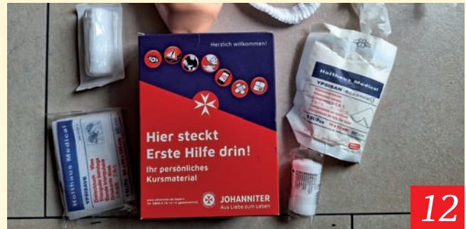
12 Auch Kinder können Erste Hilfe leisten: Bürgerstiftung Petershausen finanzierte Kurs für alle Viertklässler mit 465 Euro