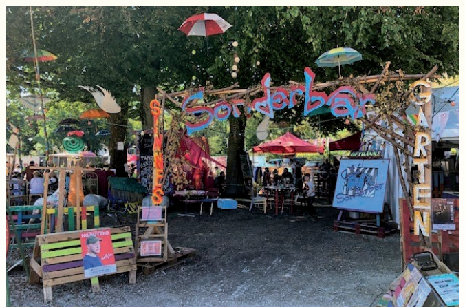
Das bunte Café „Sonderbar“ mit Galeriezelt auf dem Musik- und Kultur-Zeltfestival Kult`23 auf der Ludwig-Thoma-Wiese in Dachau.

Bei so einem breitgefächerten Programm fallen natürlich enorme Kosten an. Ziel der Veranstaltung war neben der Bekennung zu interkultureller Offenheit, Inklusion, Gleichstellung, Antidiskriminierung und Nachhaltigkeit, die Kosten für die Teilnehmer so gering als möglich zu halten. So unterstützte die Stiftung Kunst & Kultur das Musik- und Kultur-Zeltfestival in Dachau mit großzügigen 10.000 Euro. ♦