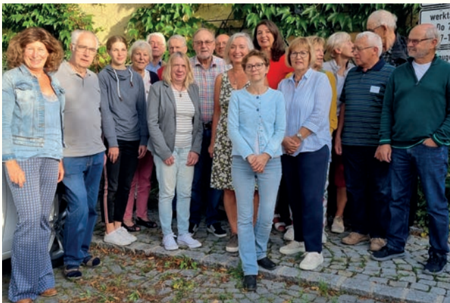
Die Forscher*innen der Geschichtswerkstatt haben ihre Arbeit aufgenommen.