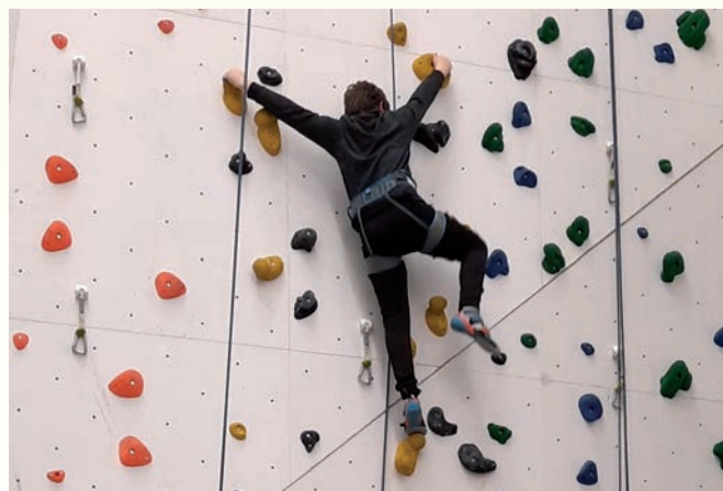
Die Kletterkids voll in Aktion – ein tolles Projekt. Text und Foto: Martin Wellisch, Caritas

Diese positive Entwicklung war auch bei den Kursteilnehmer*innen zu beobachten. So war es schön mitzuerleben, wenn die Kinder bei Kletterspielen sich gegenseitig unterstützten oder in stolze Gesichter zu sehen, wenn die eigene Angst überwunden und ein neuer persönlicher „Höhenrekord“ aufgestellt wurde. Zudem gaben unsere Beobachtungen Impulse für die Beratungen mit den Kindern und deren Eltern, so dass der Kletterkurs noch lange positiv nachwirkte. ♦