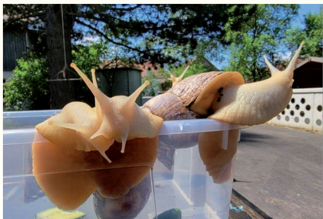
Aufgeschlossene und mitfühlende Achatsschnecken wirken beruhigend auf traumatisierte Kinder.

Außerdem ist die Anschaffung eines Terrariums für Achatsschnecken (ähnlich Weinbergschnecken) geplant. Die Schnecken haben keine Berührungsängste, lassen sich aus der Hand füttern und wirken durch ihre Art sehr beruhigend auf die Kinder. Die Stiftung Soziales der Sparkasse Dachau hat das Projekt „Tiergestützte Pädagogik“ mit 1.000 Euro unterstützt. ♦